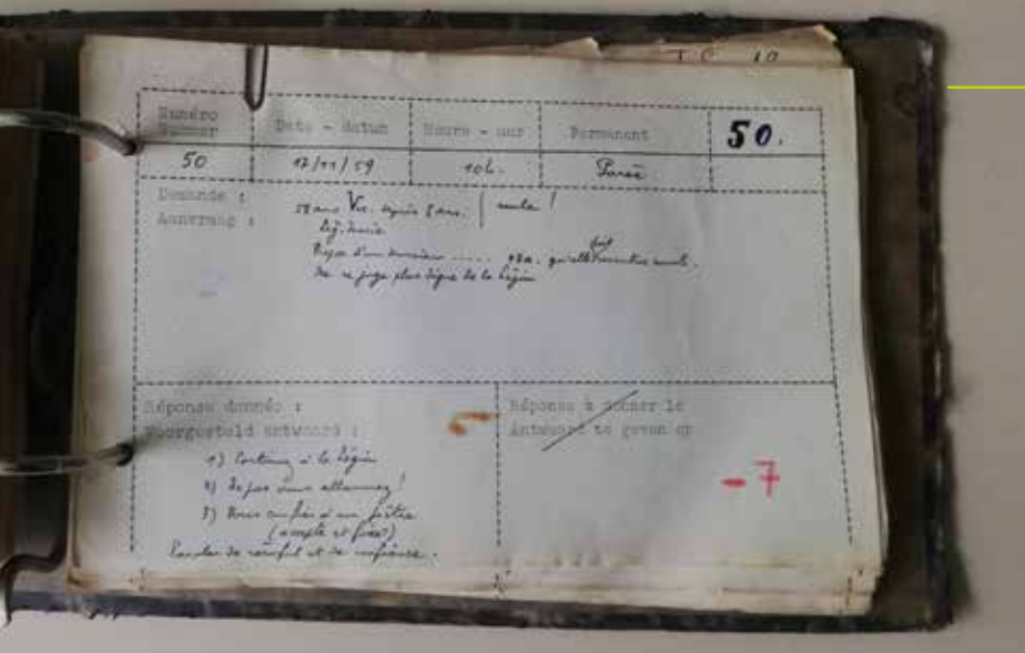
Une fiche d'écoute de Télé-Accueil, le 17 novembre 1959 à 10 heures du matin. Aujourd'hui, les écoutant-es ne consignent pas le contenu des appels; chaque échange se fait en toute confidentialité.

frère garder le contact téléphonique [...] le téléphone, qui permet à la personne de se dévoiler sans faire connaître son visage, ni son nom, constitue un meilleur truchement. »