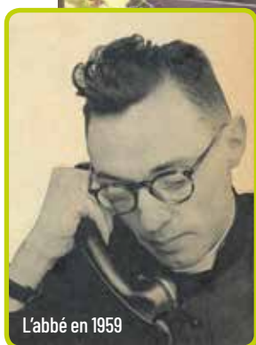
L'abbé en 1959